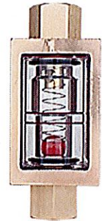
型式一覧《MKC 型 WATER SIGNAL (水用)》